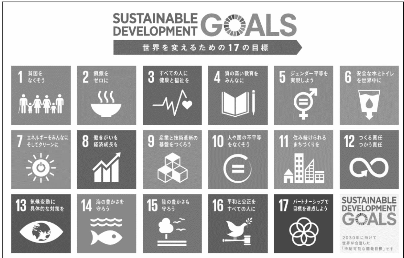
「持続可能な開発目標（Sustainable Development Goals : SDGs）」2015 国連総会

日本や世界には解決すべき課題があります。国連はそれらを「持続可能な開発目標（グローバルゴールズ）」として17項目の目標に整理しています。