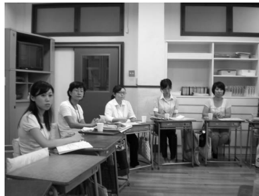
図2 意見交換会風景

・本人が成長すれば周りの生徒の対応も変わってくる、今回の報告ではどちらの成長も感じられる